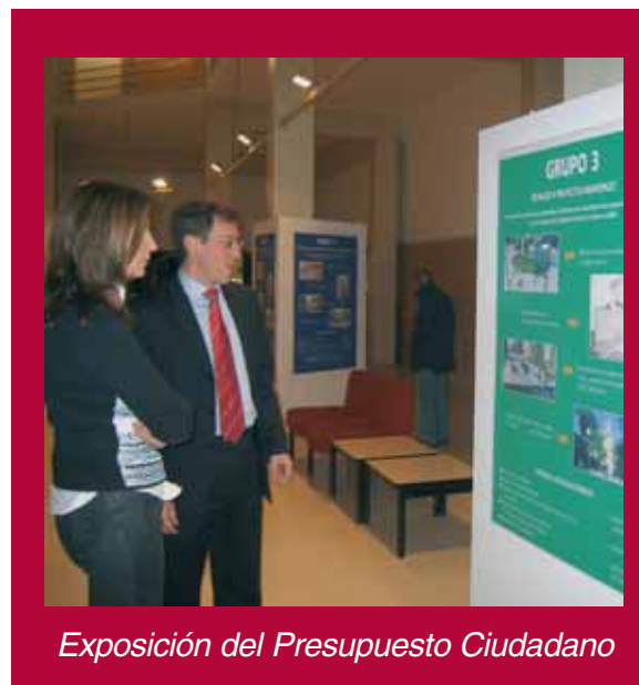
Exposición del Presupuesto Ciudadano

A través de diez paneles, se explicó la elaboración del Presupuesto Municipal -capítulo de gastos e ingresos-; los datos de participación que ha tenido el Presupuesto Ciudadano y los cinco grupos en que se dividieron las propuestas seleccionadas.