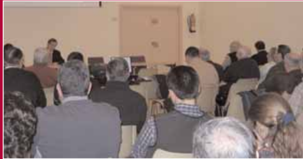
Presentación del borrador del Presupuesto Ciudadano a representantes de asociaciones

al menos, una cantidad equivalente al cinco por ciento de los gastos destinados a la inversión. Esta cantidad es la que se vinculará al Presupuesto Ciudadano, que según estimó el concejal rondará los tres millones de euros.