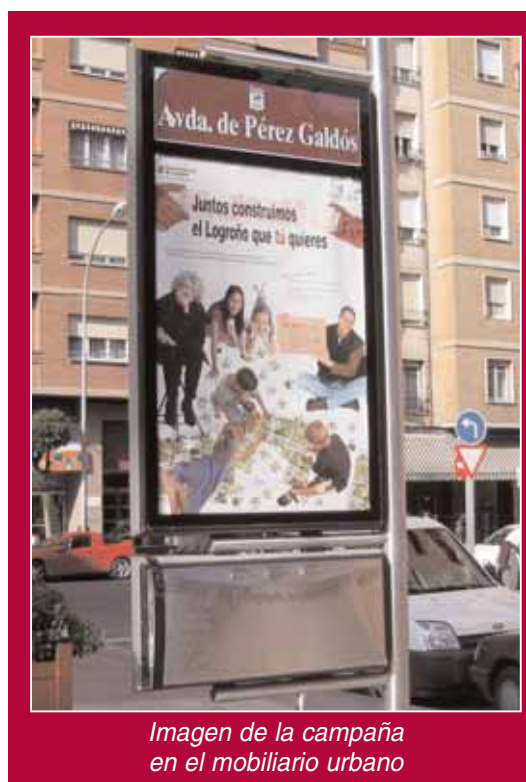
Imagen de la campaña en el mobiliario urbano

Finalmente serán aprobadas, dentro del Presupuesto Municipal del próximo año 2007, por el Pleno del Ayuntamiento de Logroño.