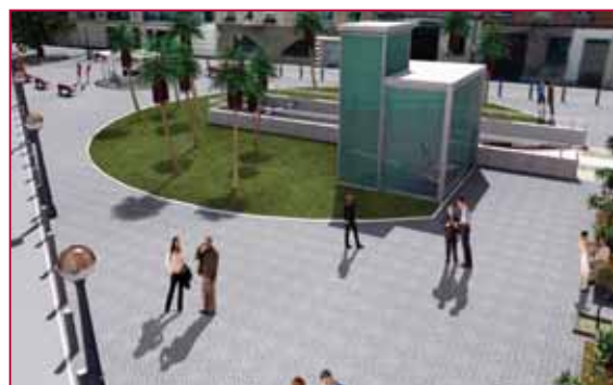
Reforma de la plaza Valcuerna, propuesta incluida en el grupo 3.

4 Este apartado recoge propuestas que, aunque son muy concretas, están incluidas en programas generales; por lo tanto no