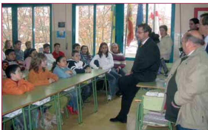
Visita del alcalde al C.P. Juan Yagüe para explicar el proceso del Presupuesto Infantil