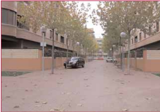
Arreglo de la calle Miguel Escalona, una de las peticiones ya realizadas

se han iniciado, adelantándose así su repercusión presupuestaria a 2005. En este grupo se incluyeron 200 propuestas y el presupuesto para su ejecución ascendió a 7.051.982,71 euros.