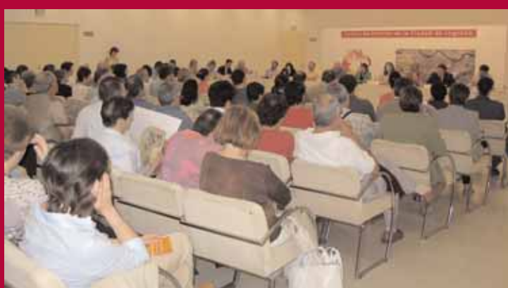
Sesión de la Junta de Distrito Centro en junio de 2005

De esta forma, el distrito Norte optó por señalar como propuestas prioritarias, aquellas relacionadas con el adecentamiento de espacios públicos, así como las medidas que impulsen el salto del Ebro y la rehabilitación de viviendas y ayudas. La Junta del Centro estableció dos criterios para priorizar las propuestas, el ornato