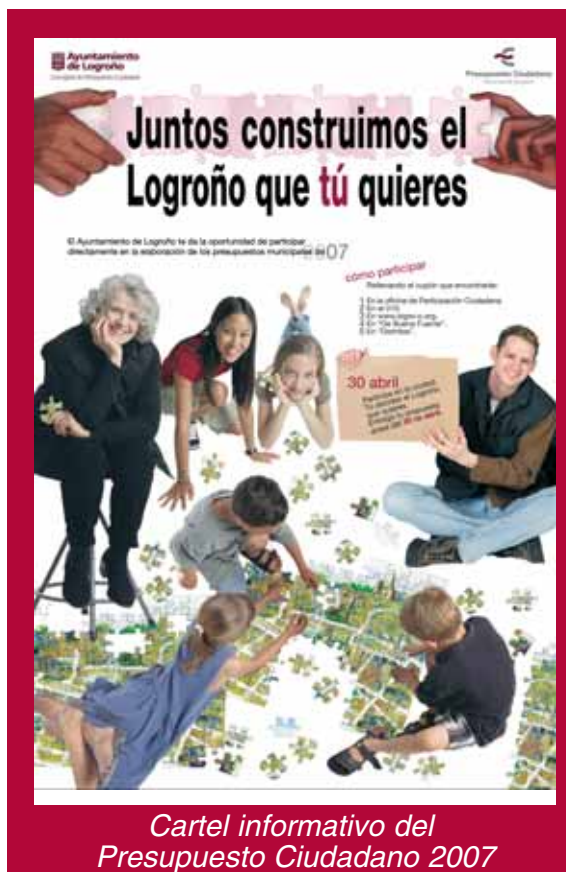
Cartel informativo del Presupuesto Ciudadano 2007

Aunque Logroño ya ha convocado dos ediciones del Presupuesto