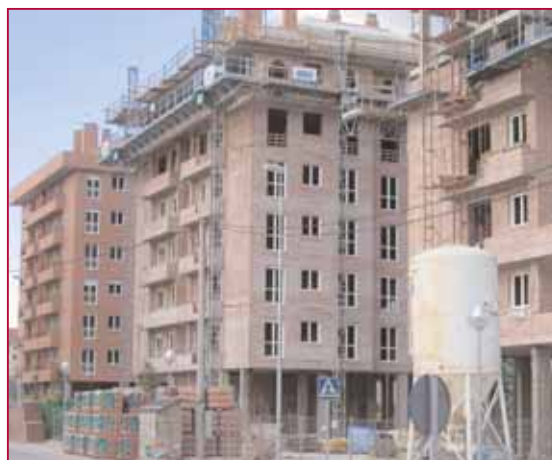
Diversas propuestas se incluyen dentro del programa municipal de Vivienda

Finalmente, el Ayuntamiento de Logroño destinó al Presupuesto Ciudadano (grupos 1, 2 y 4) 15,5 millones de euros, reflejándose en el presupuesto municipal del año 2006 unos 8,5 millones de euros.