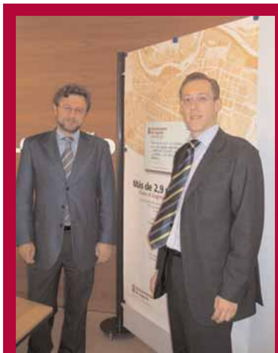
El alcalde de Logroño con el concejal de Participación Ciudadana durante la presentación de esta campaña

Además de la presentación de esta campaña a los medios de comunica-